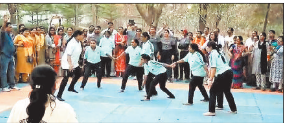
कबड्डी में भाग लेते हुए महिलाएं।

बचपन की टिकट-चलव दीदी खेल-खेले बर जाबो कार्यक्रम ने मातृशक्तियों को एक बार फिर उनके सुनहरे बचपन की यादों में लौटा दिया। ट्रांसपोर्ट नगर स्थित अशोक वाटिका में आयोजित इस भव्य आयोजन में 5 हजार महिलाओं ने उत्साहपूर्वक भाग लेकर पारंपरिक खेलों के माध्यम से अपने बचपन को फिर से जीया। कार्यक्रम में भाजपा की राष्ट्रीय उपाध्यक्ष सरोज पांडेय, उद्योग मंत्री लखन देवांगन, जिलाध्यक्ष गोपाल मोदी, महापौर संजु देवी राजपूत,